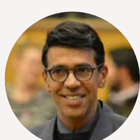
YOUNOUS OMARJEE Ministre de l'Europe