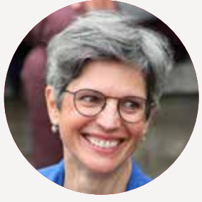
SANDRINE ROUSSEAU Ministre de l'Économie sociale et solidaire