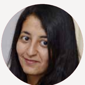
KARIMA DELLI Ministre des Transports