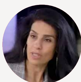
FATIMA OUASSAK Ministre de la Jeunesse et de l'éducation populaire