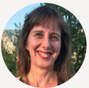
MATHILDE LARRÈRE Ministre de l'Enseignement supérieur et de la Recherche