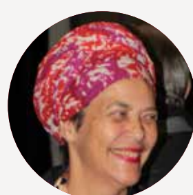
FRANÇOISE VERGÈS Ministre de la décolonisation et des mémoires