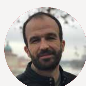
MANUEL BOMPARD Ministre de La Défense