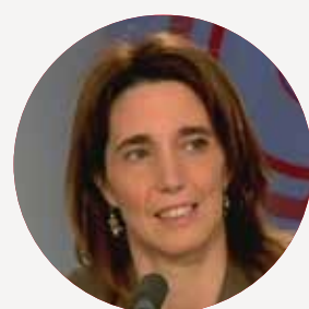
SOPHIE CAMARD Ministre de la Politique de la ville