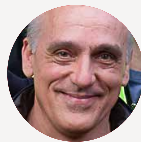
PHILIPPE POUTOU Ministre des Services publics