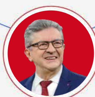
PREMIER MINISTRE JEAN-LUC MÉLENCHON