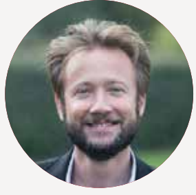
BORIS VALLAUD Ministre du Commerce extérieur