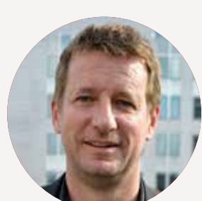
YANNICK JADOT Ministre de la Francophonie et des Outremer