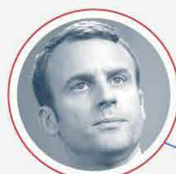
PRÉSIDENT DE LA RÉPUBLIQUE EMMANUEL MACRON