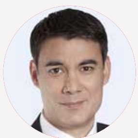
OLIVIER FAURE Ministre de l'Autonomie