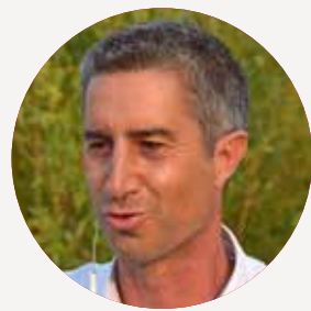
FRANÇOIS RUFFIN Ministre de l'Égalité et des Affaires sociales