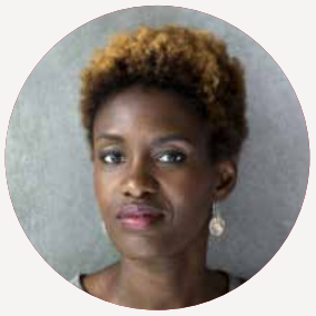
ROKHAYA DIALLO Ministre de la Justice