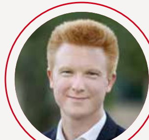
ADRIEN QUATENNENS Président de l'Assemblée nationale