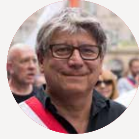
ERIC COQUEREL Ministre de la Cohésion des territoires