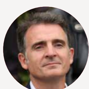
ÉRIC PIOLLE Ministre de l'Indépendance énergétique